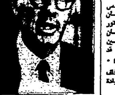
ويطلب المستشار رايبكوف بقتلها ديوان محليته للشراف على تعهداته المشروقات التي تولتها الولايات المتحدة في فيتنام .

واشنطن - د. ب. - حصد وكالة الاستخبارات على تقرير سرى وضعت لجنة خاصة في مجلس الشيوخ العسكري بشأن مجلسي صفة جاه فيه ان هناك دلائل كثيرة تثبت وقوع حوادث سرقة ورتسوة واختلاس وبيع في المشروعات التي تنفذها الولايات المتحدة في فيتنام الجنوبية حيث « تلحق ملايين الدولارات بسبب العجز والفساد ووقلة القضاة » .